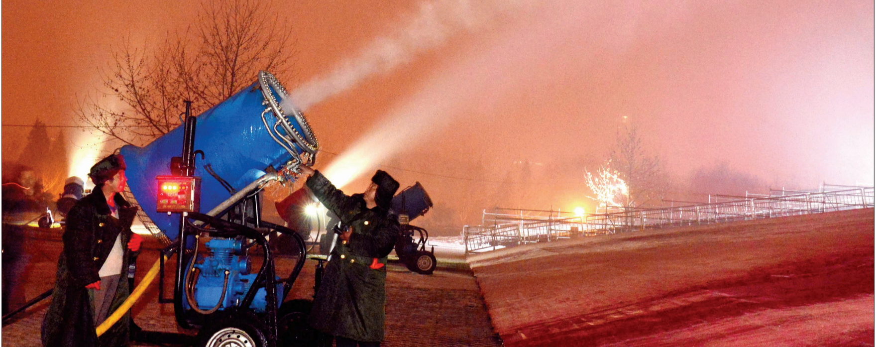
造雪机造雪速度还真不慢