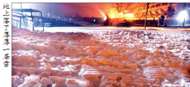
地上落了厚厚一层雪