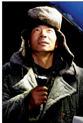
造雪人在寒风中观察造雪机工作情况