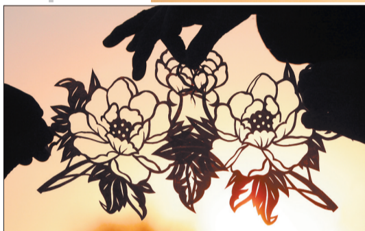
牡丹剪纸配夕阳——你能否闻到花香