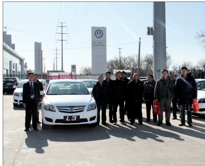
1月20日,宜阳云龙驾校一次性采购20台比亚迪经典车型L3交车仪式在宝祺比亚迪4S店举行。据了解,云龙驾校本次选择比亚迪作为以后换车的优选车型,是看中了比亚迪汽车在同类车型中所具有的超高性价比。