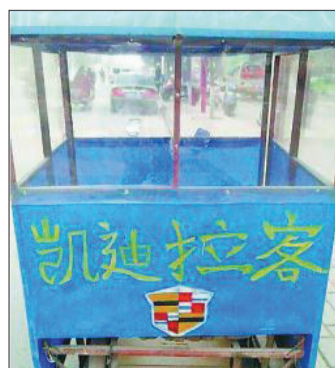
@生活报:好拉风的豪车!