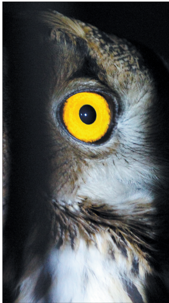
雕鸮晚上变成了“大眼”