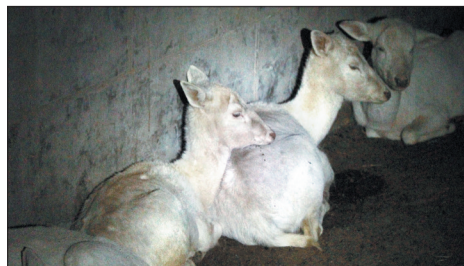
白黧鹿卧在地上打盹儿