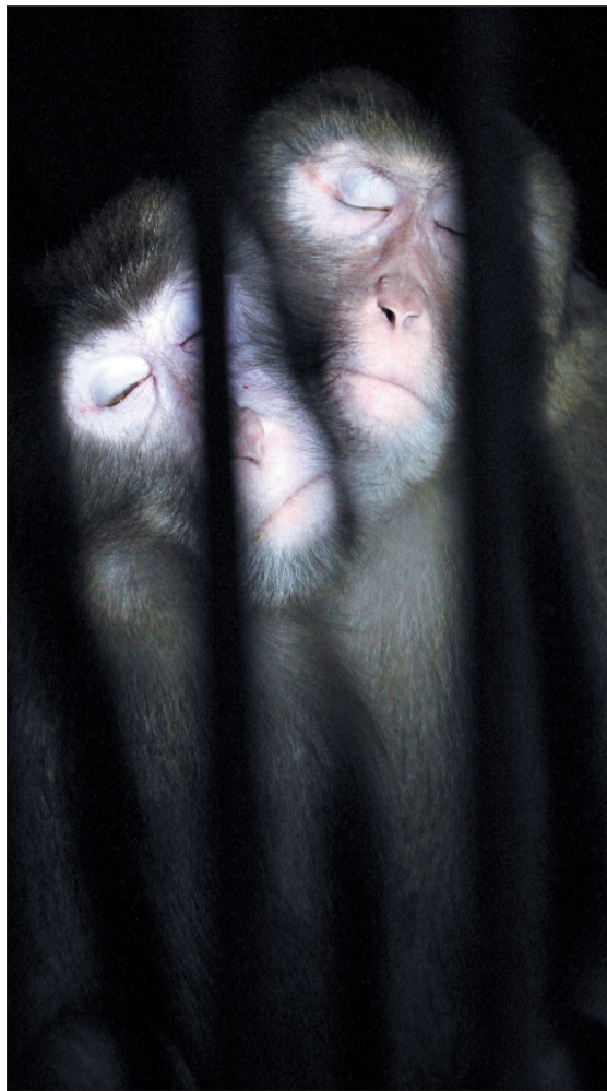
两只猴子相互依偎睡得正香