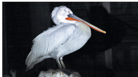
卷羽鹈鹕把嘴放在弯曲的脖子上睡觉