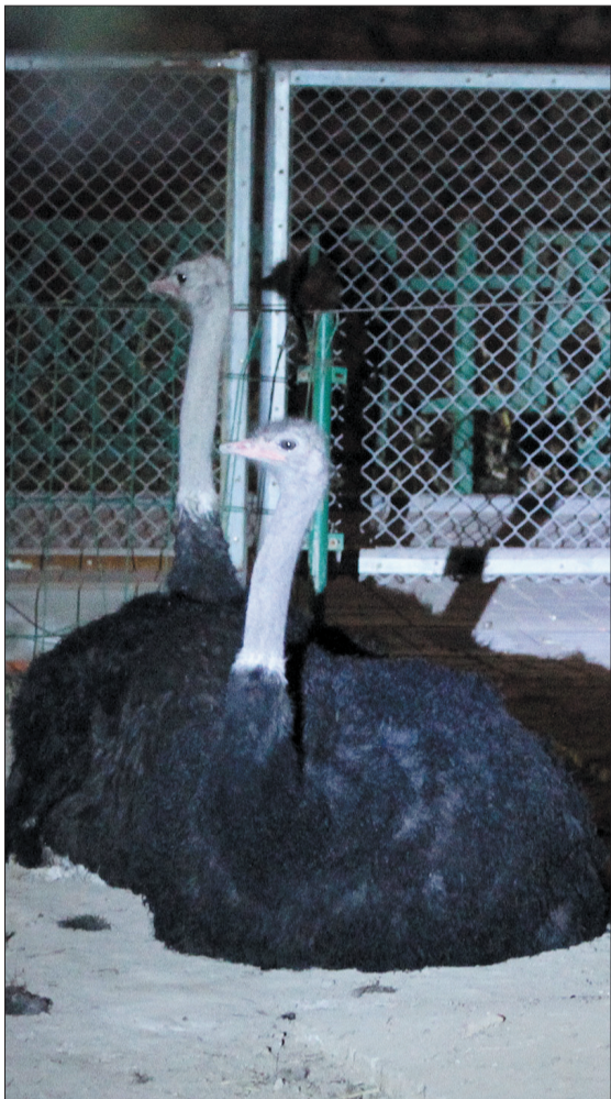
鸵鸟睡觉也保持高度警惕