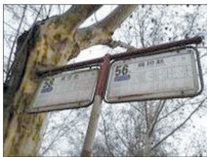
扁担赵公交站 (资料图片)