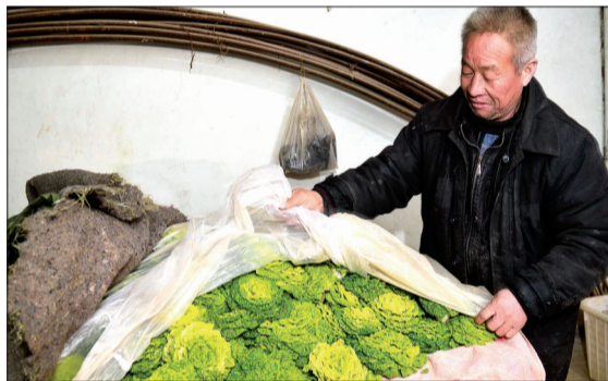
菜都提前洗好、码整齐了