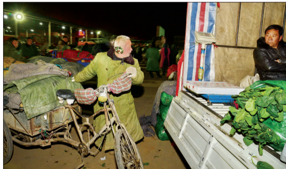
老肖推着车在市场里找位置