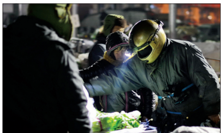
天儿太冷,买主都捂得严严实实的