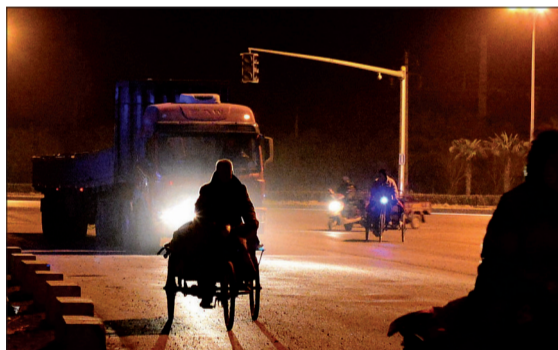
凌晨三点多,老肖已经在路上了