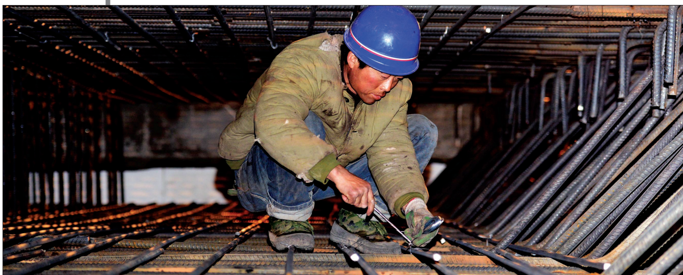
中图:别小看捆扎钢筋工作,这需要力量和技巧