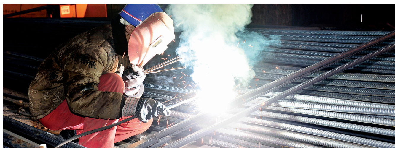
下图:点点焊接火花,见证了他的汗水和努力