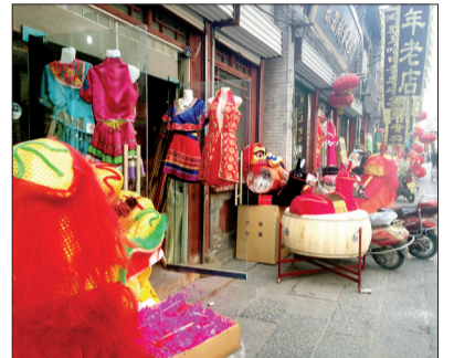
老城区东大街的演出服饰出租店生意冷清