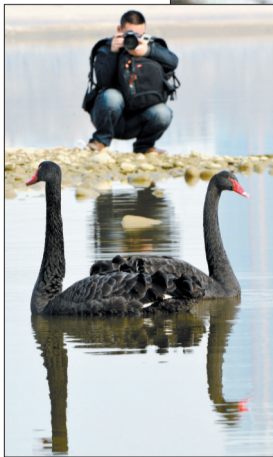
上图:即便有人走近拍照,两只黑天鹅仍悠然自得 右图:水中的倒影随波荡漾,好似一幅水墨画