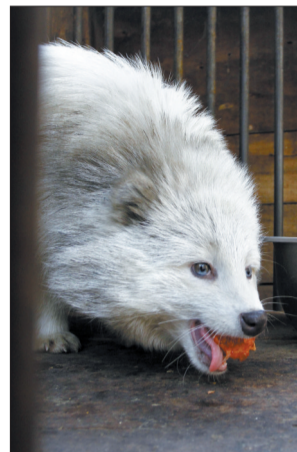
“银狐妹妹”吃相还挺秀气

外面的动物到动物园后,都要进行隔离检疫,看是否有疾病。经过隔离观察,这只狐狸并无异常。23日,它还被注射了疫苗。