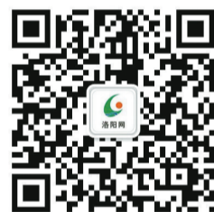
洛阳网官方微信二维码

方微信本着“关注热点、服务百姓”的原则,每天不间断更新头条、天气预报、民生新闻、小贴士等资讯,受到粉丝的一致好评。目前,洛阳网官方微信的粉丝量已突破1.3万。