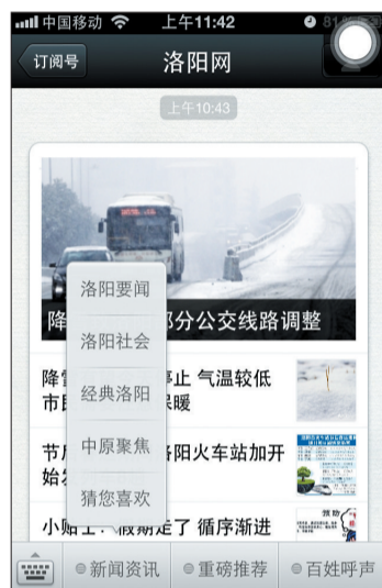
洛阳网官方微信新增的菜单

洛阳网官方微信开通于2013年3月,微信号为“lydcomcn”,名称为“洛阳网”。自开通以来,洛阳网官