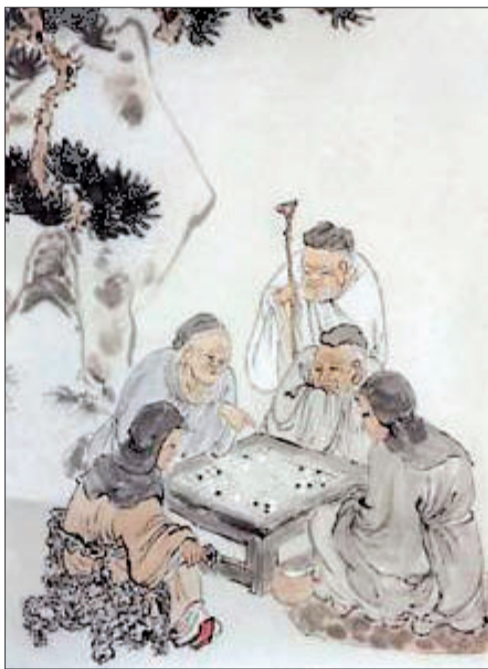
民间围棋 (均为资料图片)