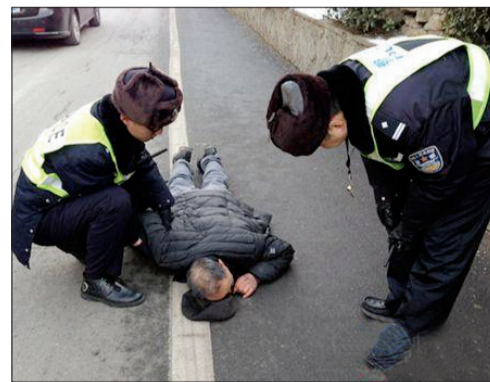
事发现场

我?”令民警哭笑不得,幸亏民警执勤时随身携带执法记录仪,才还自己清白。民警提醒大家,看到有人摔倒,还是要扶的,但一定要保留相关证据。