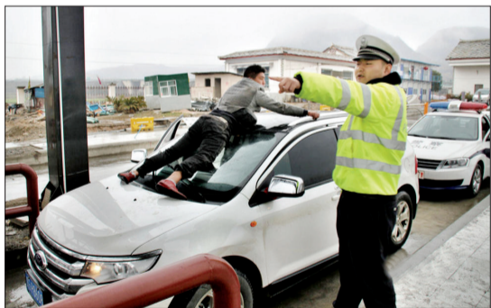
越野车前挡风玻璃上趴着一男子