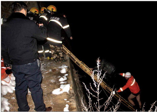
消防队员正在营救被困男子

为尽快将男子救出,消防队员赶紧放下消防拉梯。拉梯一端接触到地面后,一名消防队员顺着拉梯下去。