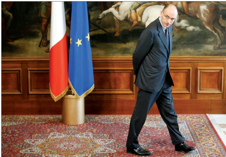
这是二〇一三年五月二日在罗马拍摄的恩里科·莱塔出席会议的资料照片