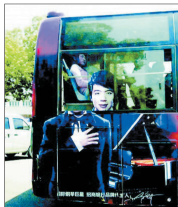
@生活报:朗朗,你不弹琴开始苦练魔术了吗?