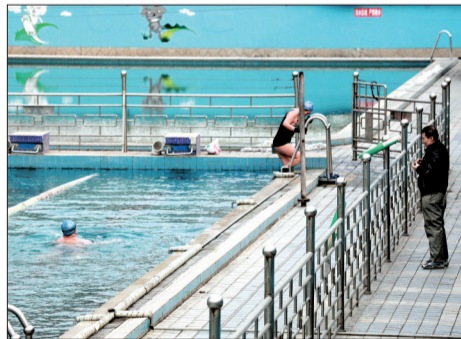
畅游几周寒未觉 从容上岸乐陶陶