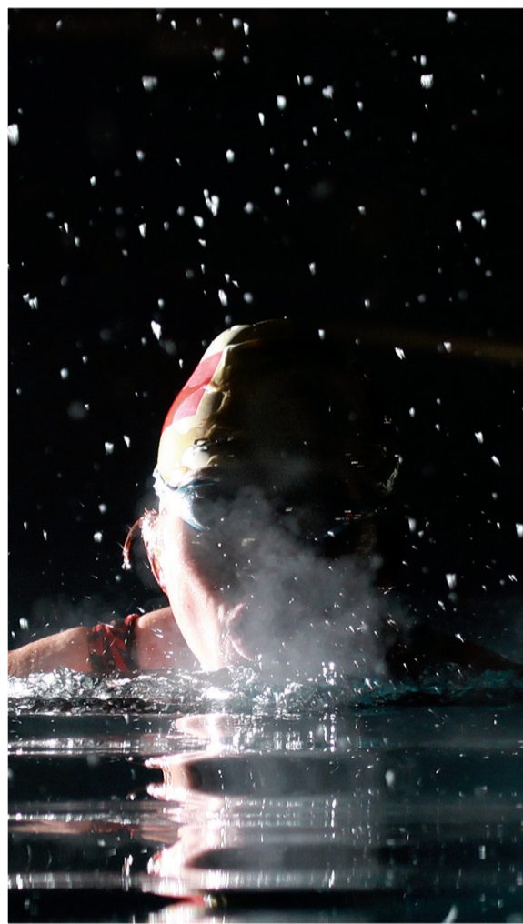
不畏漫天飞大雪 气嘘冰破若游龙