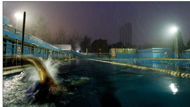
敢赴晶宫擒锦鲤 勇击冰浪斗苍龙