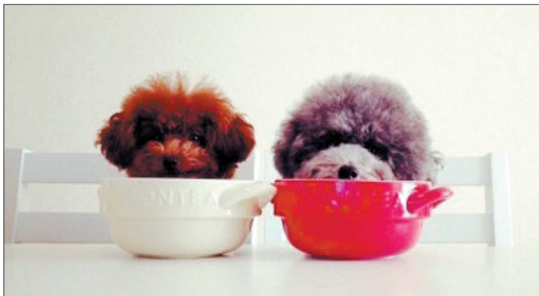
▲ 待在茶杯里真舒服