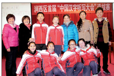
19日上午,涧西区首届汉字听写大赛在东升二小举行。此次共有20所学校的代表队参赛,最终,东升一小代表队荣获冠军,东方二小代表队荣获亚军。图为东升一小代表队合影

该校校长王建林说,中学生的心智还不够成熟,辨别是非的能力有待提高,举办法制报告会就是为了增强学生的法制意识,帮助学生更好地知法、懂法、守法。