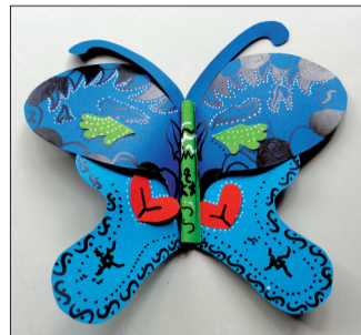
蝴蝶(手工纸制品) 市实验小学新区分校四(3)班 范洛麟 作 辅导教师:李小娜