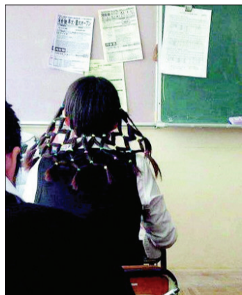
@生活日报：待我长发及腰，编成小辫可好？