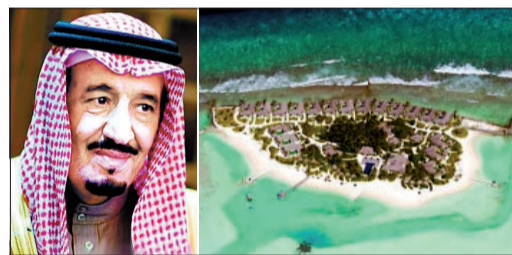
沙特王储萨勒曼 萨勒曼包下的度假村(网络图片)

巴佛对酒店的做法非常不满,认为度假村的态度是“只要有人有钱包下整座岛,就不必理会提早预约的游客”。度假村方面驳斥了这种说法,认为这是“特殊情况”,只能尽力让其他客人满意。