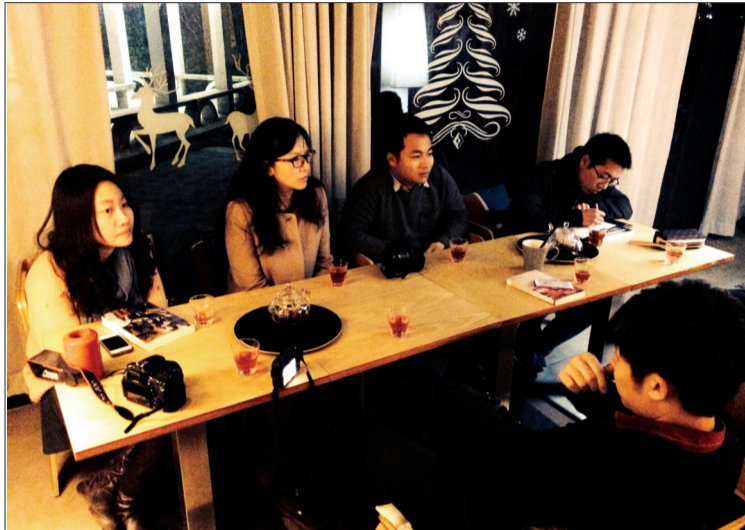
读书会现场

23日晚8时,第三期“洛城读书会”举办。参加此次读书会的8名成员中有自主创业者,有设计师,有年轻白领,他们就对职场生涯有影响的书发表了各自的见解。