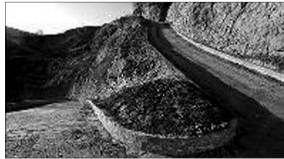
专用道 水利局局长在祖坟前修的