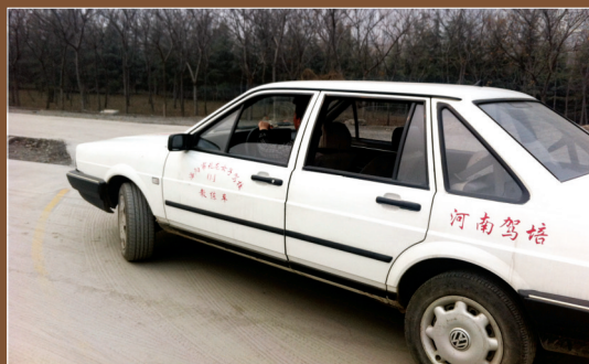
学员使用教练车练习