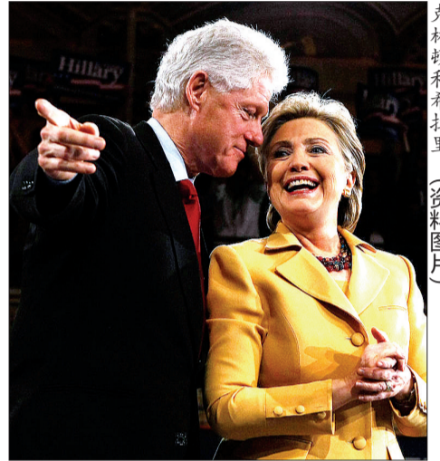
克林顿和希拉里 (资料图片)