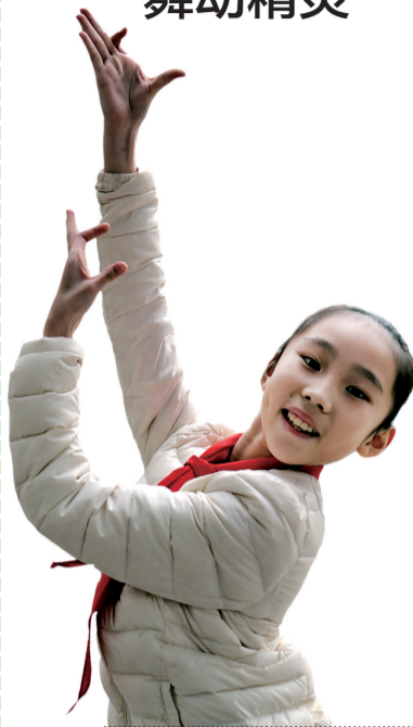
□记者 李书平 文/图