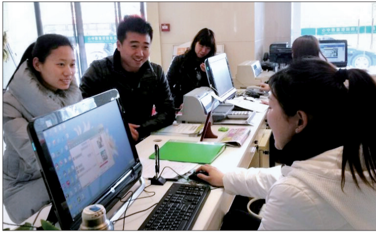
游客咨询旅游事宜

洛阳旅游集散中心具有游客随到随走的集散功能,不管是外地游客还是本地游客,到集散中心以后,只要是该中心拥有的发车旅游线路,就能够快速、有效地前往目的地,哪怕一个人也可以发团,从而大大节省了游客的时间。同时该中心还拥有二级场站,无论是散客还是大批游客,集散中心都可以满足其要求。