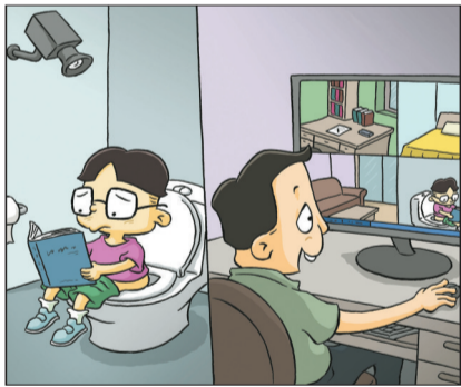
▲时刻监控孩子学习