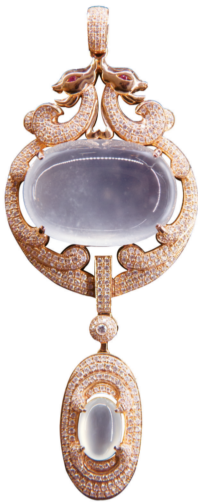
精美的蛋面翡翠挂件 (资料图片)

如果您钟情于素面翡翠，如果您也想一睹“美人”容颜，不妨在3月20日至26日与我们共聚洛阳东方神韵翡翠各店。