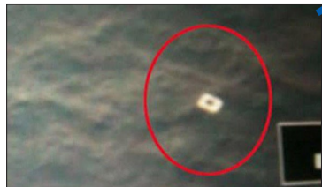
越方发现疑似属于失联客机物体的照片