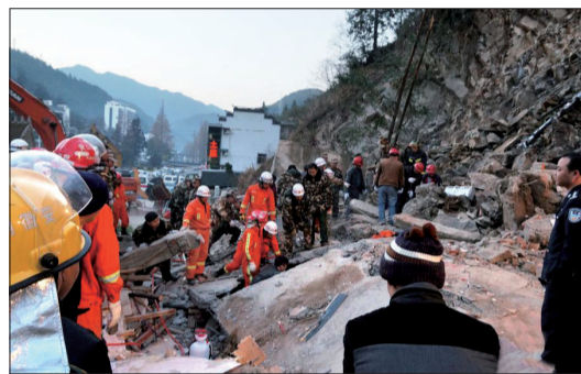
救援现场