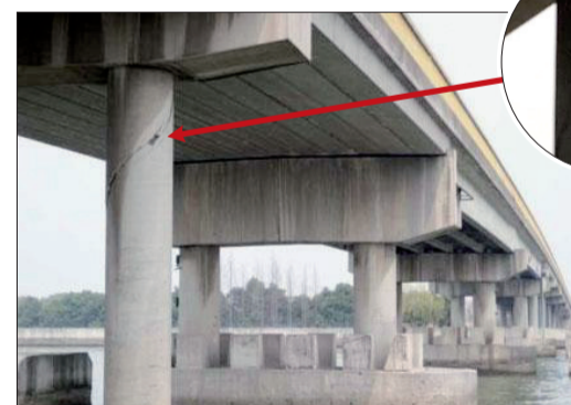
桥墩出现裂隙