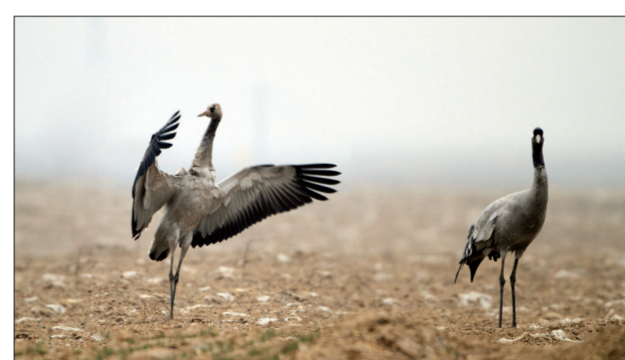
一只灰鹤在扇动翅膀,准备长途飞行 (3月11日摄于孟津)