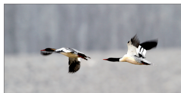
中华秋沙鸭 (2月28日摄于嵩县)