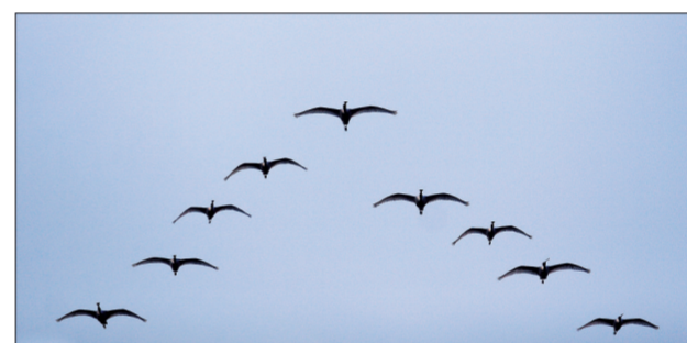
白琵鹭排成人字形迁徙 (3月2日摄于嵩县)