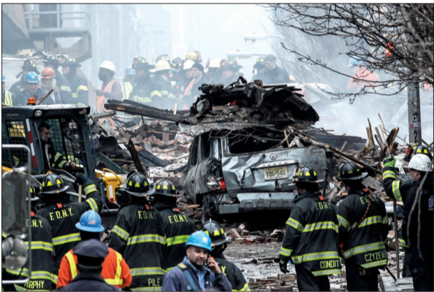
▲ 3月12日,美国纽约爆炸事故现场冒出浓烟

亚宁娜目前只有1周大。“我看着她,简直无法相信这是真的。现在我会对14岁的儿子说,在你‘姐姐’面前要乖乖的。”莫妮卡说。