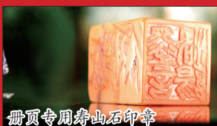
册页专用寿山石印章