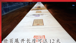
册页展开长度可达12米