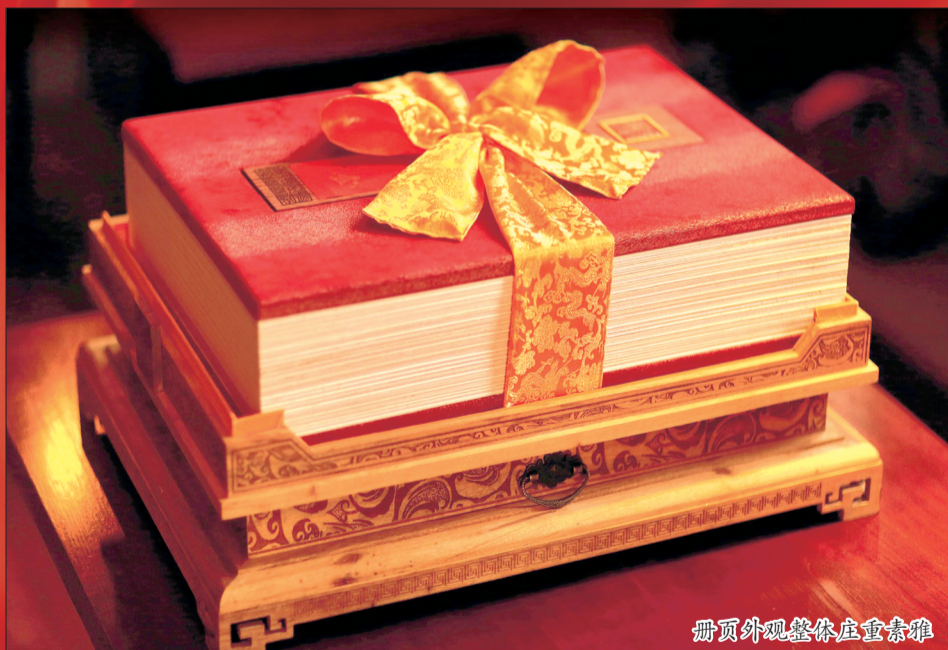
册页外观整体庄重素雅