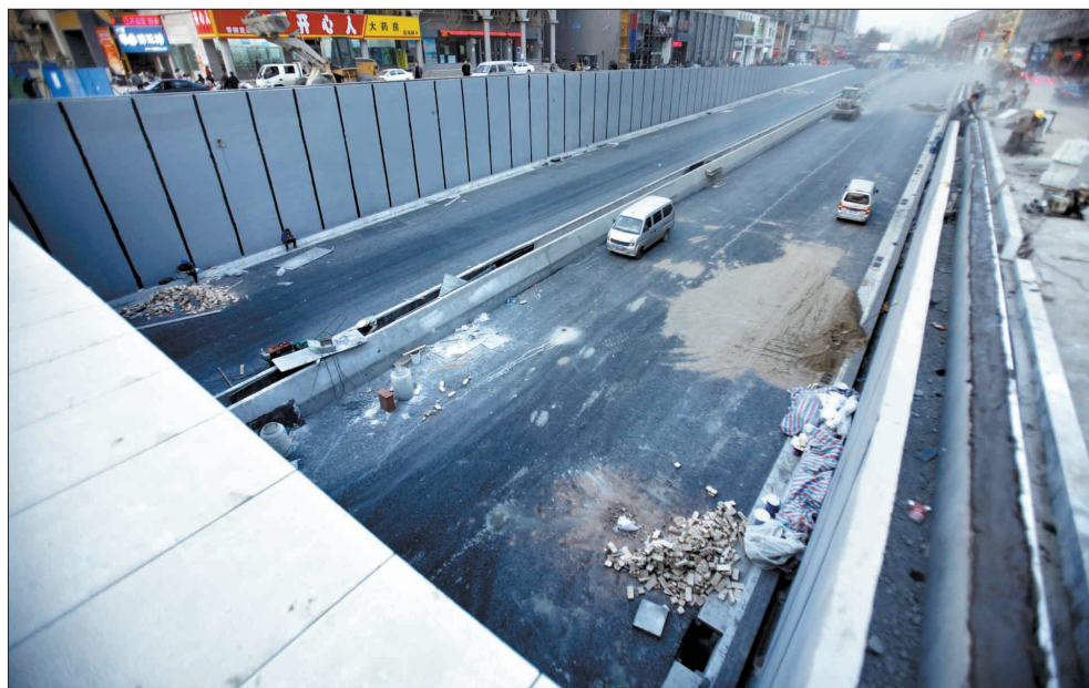
九都路下穿解放路立交工程施工现场