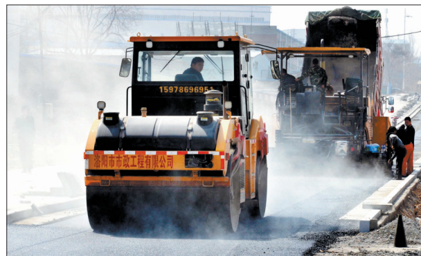
施工人员正在摊铺沥青

该项目施工方洛阳市市政工程集团有限公司工作人员表示,为确保工程质量,该路机动车道将摊铺三层沥青,两侧非机动车道将摊铺两层沥青,以保证车辆通行的平顺度,延长道路使用寿命。如果天气情况良好,本月底,作为城市区交通干道的秦岭路将竣工通车。