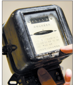
20世纪50年代我国生产的电表