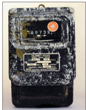
1984年匈牙利生产的电表