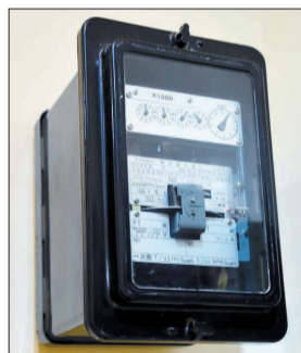
20世纪80年代日本生产的电表