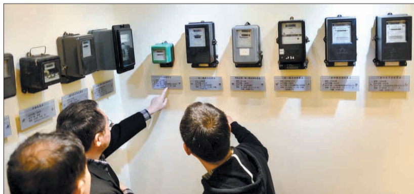
展厅里有多种电表

在这个电表“博物馆”内,有容量仅1安培的迷你电表,有55岁“高龄”仍能正常运转的老电表,有罕见的产自匈牙利、美国、日本等国的洋电表,还有计算整个洛阳用电量的“大总管”电表……总计近百块(幅)电表实物和照片为您展示中外电表的进化史。