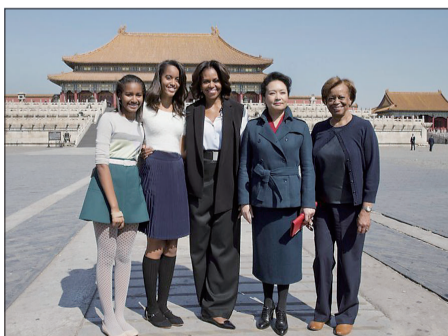
彭丽媛与米歇尔一家在故宫合影