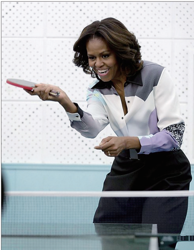
米歇尔练习打乒乓球