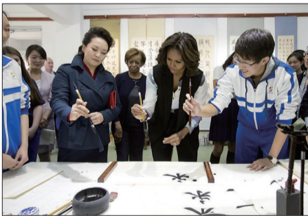
彭丽媛向米歇尔示范如何握笔

彭丽媛表示,中美文化和教育各有特色,可以互学互鉴。希望更多的美国朋友能够分享你们在中国的见闻,了解中国悠久的历史文明和当代发展进步,也希望你们把中国人民的友谊传递给美国人民。