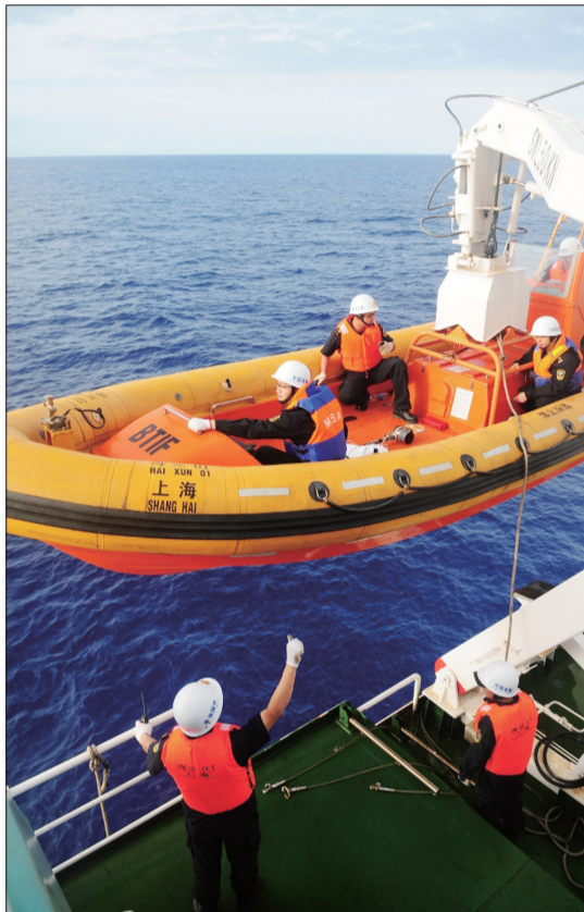
3月28日上午,在南印度洋,“海巡01”轮海事工作人员携带黑匣子搜寻仪乘坐小艇准备出发搜寻

据中国海上搜救中心副主任智广路介绍,澳大利亚搜救中心公布了最新搜寻区。澳方派出“成功”舰和10架固定翼飞机前往搜寻。交通运输部所属的“海巡01”轮于北京时间28日凌晨抵达该区域展开搜寻。