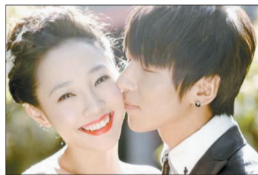
白百何(左)和陈羽凡