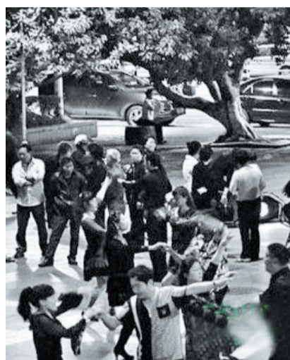
「警告」发出当天，广场上依旧热闹