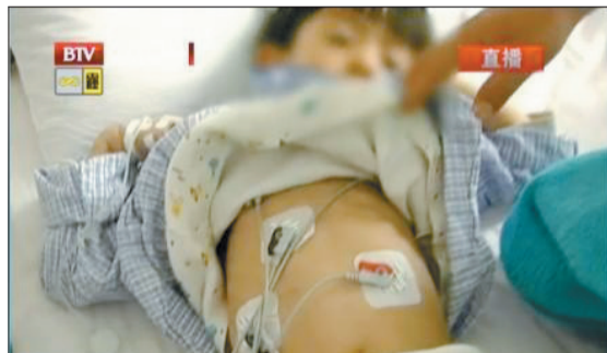
男童正在医院接受治疗