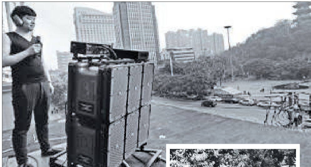
调音师正在调试远程音响