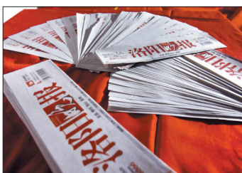
用“咱家的报”创作,表达对家乡的爱

此后,他的创作生涯迎来一片光明——美国芝加哥红宝塔画廊、美国艺莱画廊、中德艺术家联展、迈阿密艺术家博览会……他用纸质材料编织成的艺术品,越来越多地出现在国际舞台上。