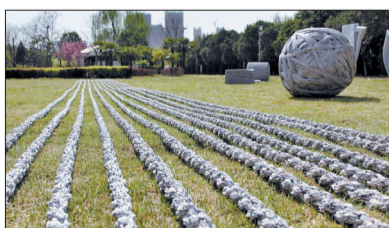
用《人民日报》做成的“向心力”线球、“麻绳”、“布匹”