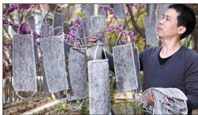
用《北京晚报》制作的口罩