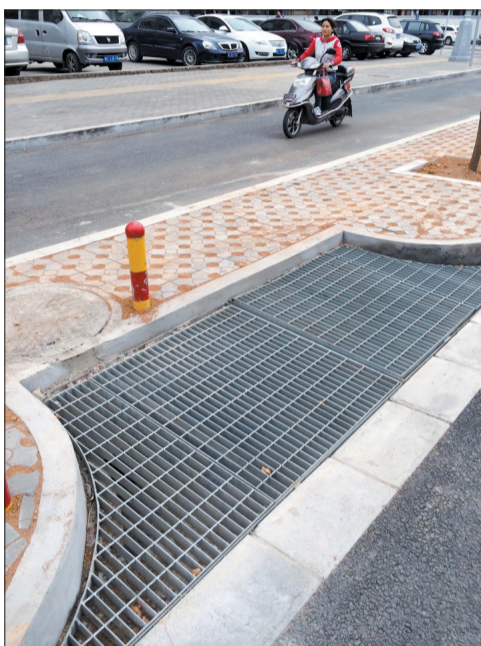
九都路与金业路交叉口的大型收水口