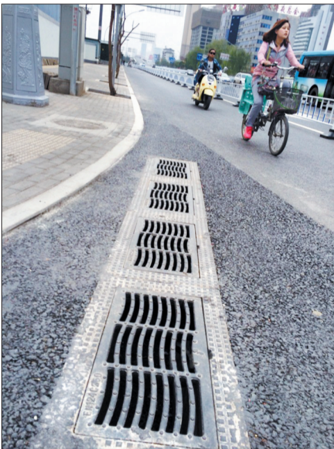
易积水路面增设了四算雨水口