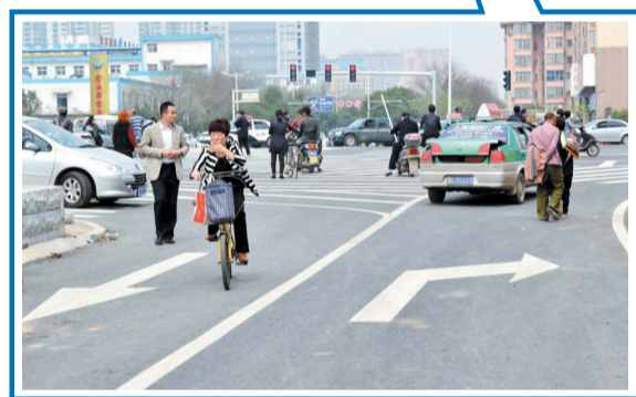
照片中的白色斜线是导流线,机动车禁止压线行驶