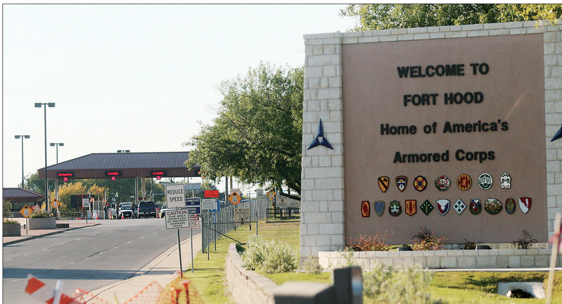
这是2009年11月5日拍摄的美国胡德堡军事基地入口的资料照片