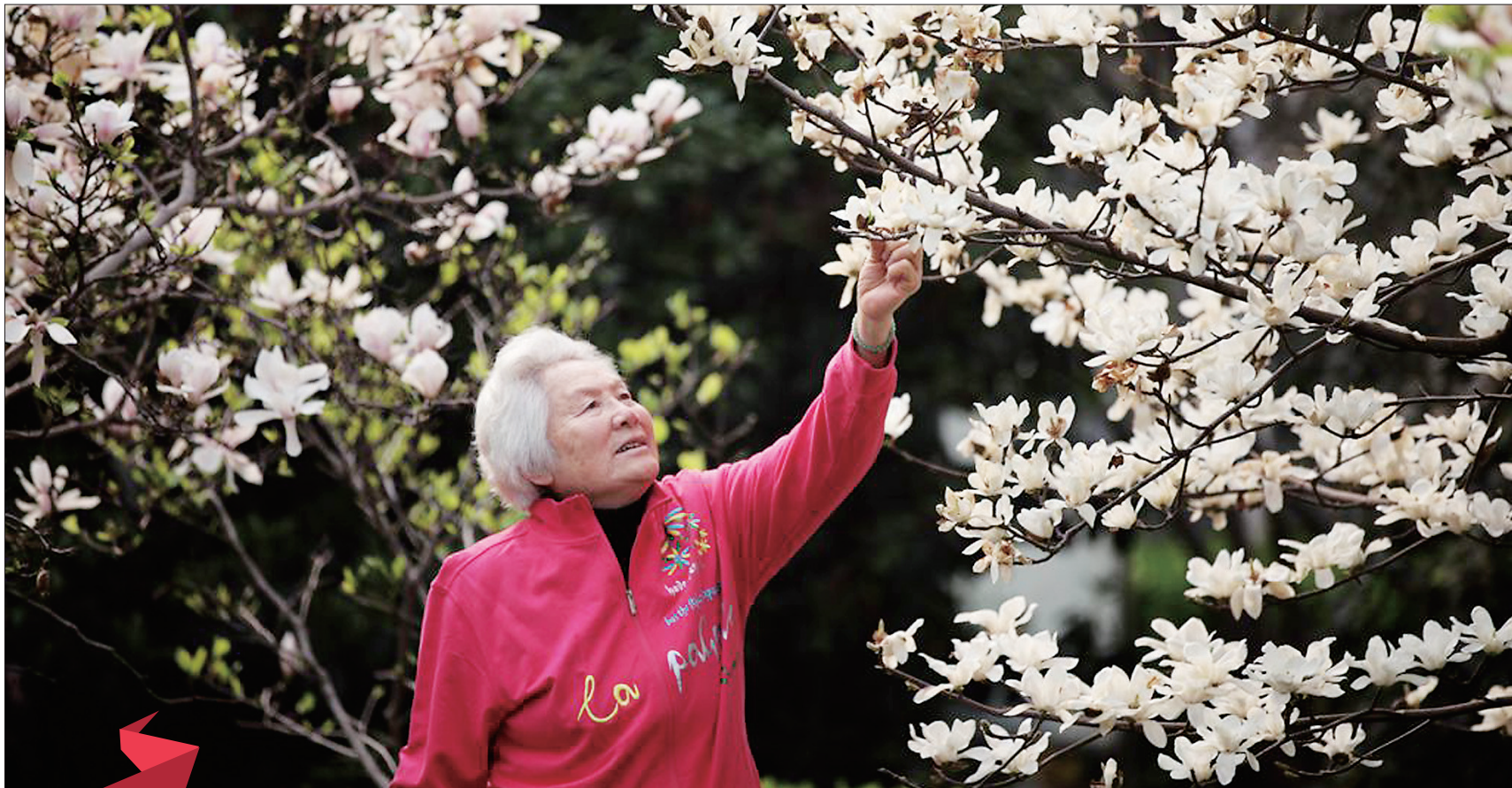
涧西区黔川路附近一小区