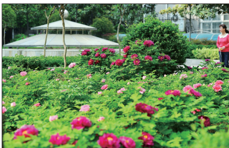
西工区香榭里·阳光小区

燕子在梁间呢喃,细雨轻洒在花前,柔软的风轻拂着我们的脸庞……暖暖的春日里,身边总是有很多惊喜,也许是昨夜那轰隆隆的春雷声,也许是阳光下轻舞的柳絮,又或许是清晨开窗时扑面而来的花香。春天在哪里?一起来看看洛阳晚报记者和拍客用光影记录的社区里那动人的春色吧。