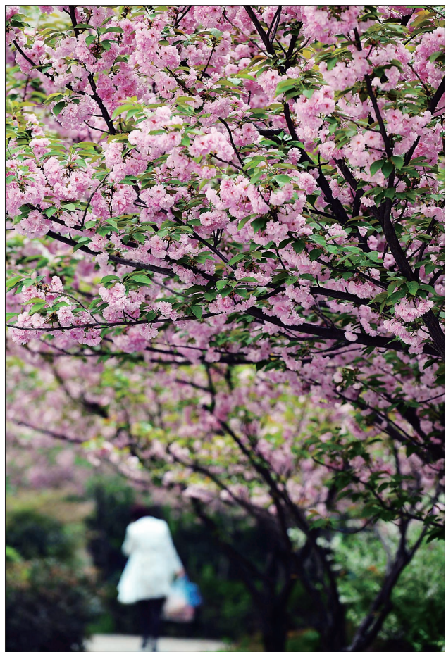
西工区香榭里·阳光小区