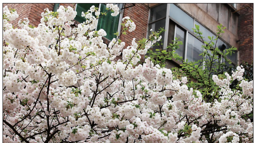
涧西区西苑社区一小区