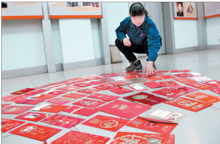
韦洛丽展示她收藏的请柬