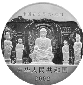
的正面图像 龙门石窟纪念银币