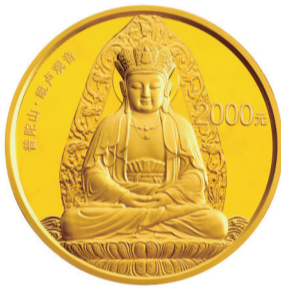
毗卢观音纪念金币

中国人民银行于2002年4月10日发行了中国石窟艺术——龙门石窟金银纪念币一套,以艺术的手法将龙门石窟再现于金银纪念币之上,是我国传统民族工艺与现代造币技术的完美结合,再现了龙门石窟艺术的神韵。