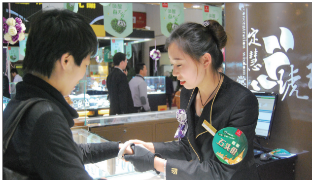
市民正在挑选翡翠手镯

作为洛阳翡翠销售史上规模最大的一次展销会,金鑫珠宝翡翠文化展打出了“翡翠石头价”的口