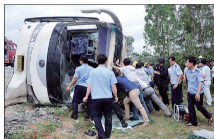
救援人员在事故现场展开救援