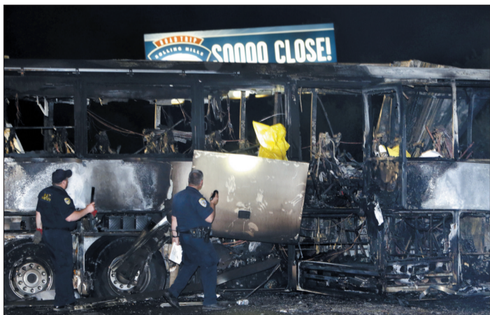
工作人员在查看车祸现场，大客车和卡车相撞后起火燃烧损毁